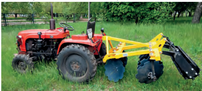
Рисунок 1 – Загальний вигляд дискової борони GiaRDino

Технічні параметри борони: маса борони – 375 кг, діаметр зубчастого диска – 56 см, товщина диска – 0,5 см; тип диска – сферичний з вирізною крайкою; крок установки дисків в ряду – 32,5 см; відстань між рядами дисків – 78 см; кількість вирізів по твірній диска – 9 шт; кількість дисків – 8 шт; коток: тип – ребристий циліндр, ширина – 160 см; кількість планок по твірній котка – 8 шт; габаритні розміри: ширина – 188 см; довжина – 190 см; висота – 105 см;