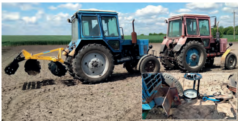
Рисунок 2 – Проведення тягових випробувань дискової борони GiaRDino