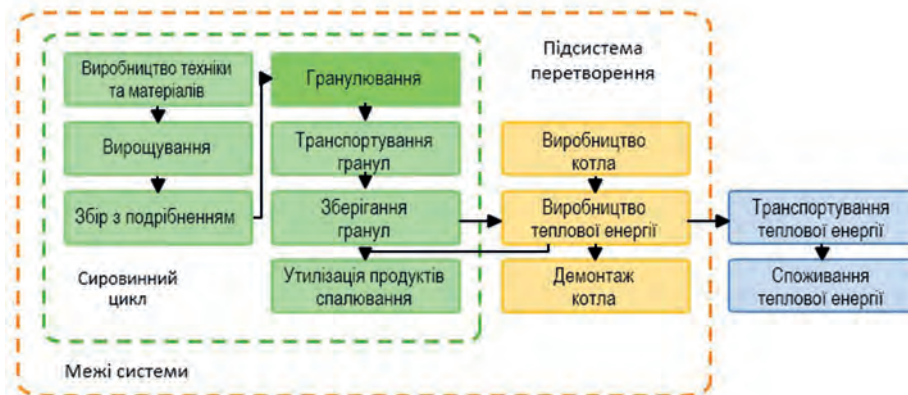
Рисунок 2 – Схема і межі життєвого циклу виробництва теплової енергії з гранул енергетичних рослин

підсистема перетворення. Зазвичай, сировинний цикл біоенергетичного проєкту розпочинається з етапу збирання біомаси. Основною особливістю ОЖЦ використання енергетичних рослин є врахування в сировинному циклі етапу їх вирощування, який складається з виробництва необхідної техніки та матеріалів і безпосередньо вирощування (рис. 2) [Трибой О. В. та ін., 2019].